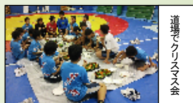
道場でクリスマス会

【お問い合わせ】生駒市レスリングクラブ 西まで TEL：090-3670-1678