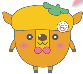
イメージキャラクター (てじかっきー)