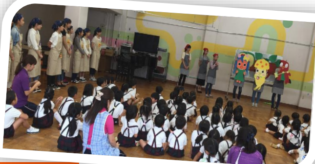
左から) カロテンちゃん、ビタミンCちゃん、センイチちゃんが、みんなの体を元気にしてくれます！