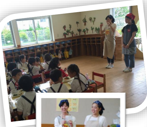
↓ 大豆とおじゃこは、カリカリして、おいしいよ