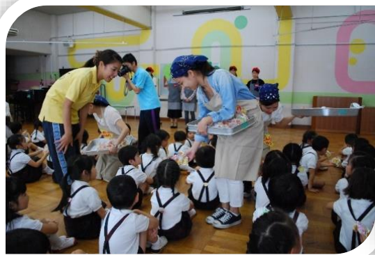
↑ 学生が手作りの焼き菓子をプレゼント