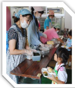
↑ 先生方が給食をお皿に盛りつけてくださいます、お皿をしっかり持って、教室まで運んでね。

かぼちゃとさつまいものお話では、学生の問いかけに元気に答えてくれた園児たち。給食の準備が整うまで、学生は子ども達と楽しい会話ができました。栄養素の人形にさわって、確認。「カロテンちゃんは、みんなが大きくなるのを助けます。ビタミンCちゃんは、病気に負けない強い体を作ります。センイチちゃん、お腹の中をすっきりお掃除してくれます。」