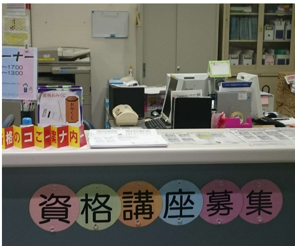
【学園前】 16号館2階キャリアセンター内