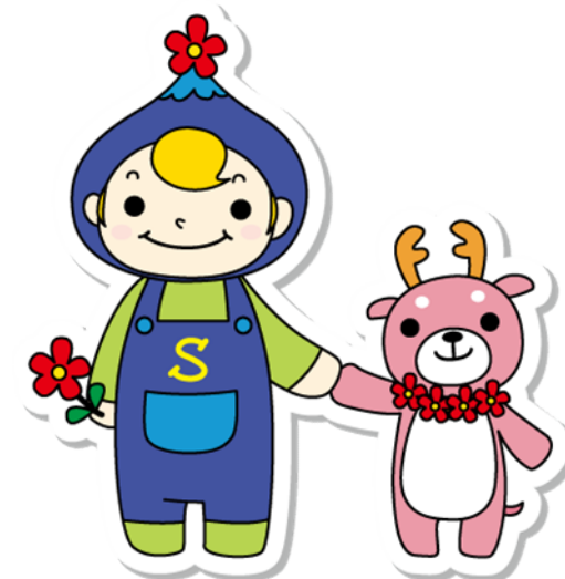
資格コーナー公式イメージキャラクター (左) しゅうとくん / (右) しかまる

Mail : shikaku-h@jimu.tezukayama-u.ac.jp