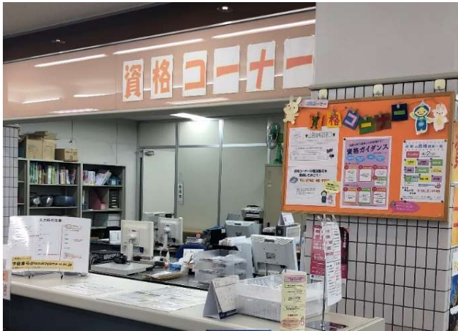
【東生駒】 9号館2階キャリアセンター内